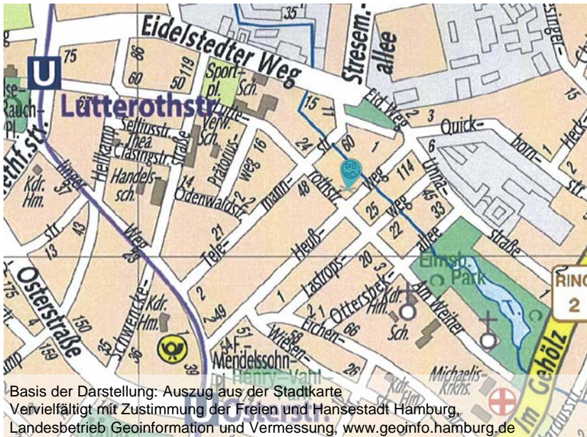
Basis der Darstellung: Auszug aus der Stadtkarte Vervielfältigt mit Zustimmung der Freien und Hansestadt Hamburg, Landesbetrieb Geoinformation und Vermessung, www.geoinfo.hamburg.de