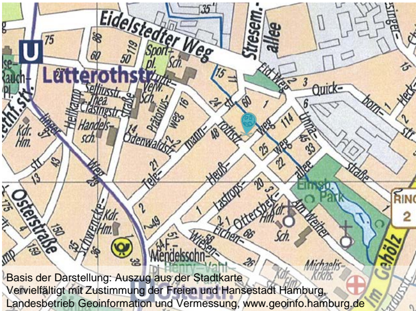
Basis der Darstellung: Auszug aus der Stadtkarte Vervielfältigt mit Zustimmung der Freien und Hansestadt Hamburg, Landesbetrieb Geoinformation und Vermessung, www.geoinfo.hamburg.de