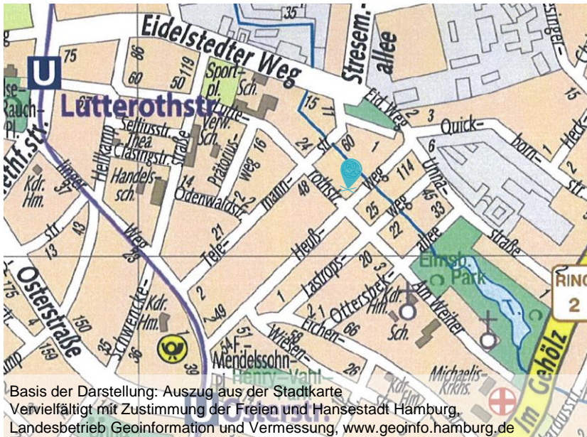
Basis der Darstellung: Auszug aus der Stadtkarte Vervielfältigt mit Zustimmung der Freien und Hansestadt Hamburg, Landesbetrieb Geoinformation und Vermessung, www.geoinfo.hamburg.de